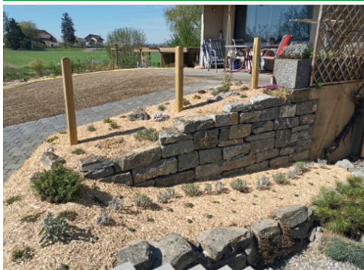
* Sanierung von Gartentritten * Gartenholzerei und Rodungsarbeiten * Winter- und Pflegeschnitt von Stauden und Sträuchern oder durch unsere ausgebildeten Baumkletterer auch an Alleebäumen * Winterdienst etc.